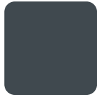
GRIS PIZARRA TE-09