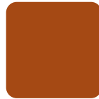
ROJO TEJA TE-03