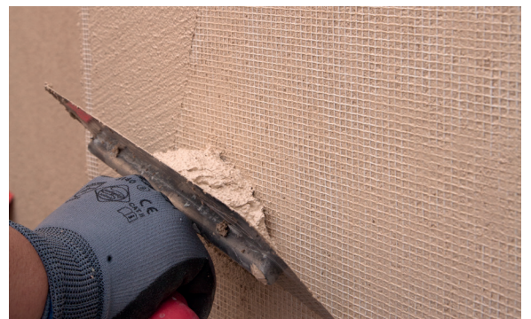
8. Cubrir la malla con PX-28 Isolxtrem SILOXANE TECHNOLOGY G.