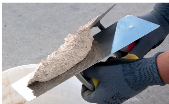
3. Colocar PX-28 Isolxtrem SILOXANE TECHNOLOGY G en la llana.