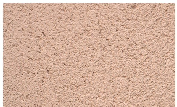
10. Acabado final del PX-28 Isolxtrem SILOXANE TECHNOLOGY G.