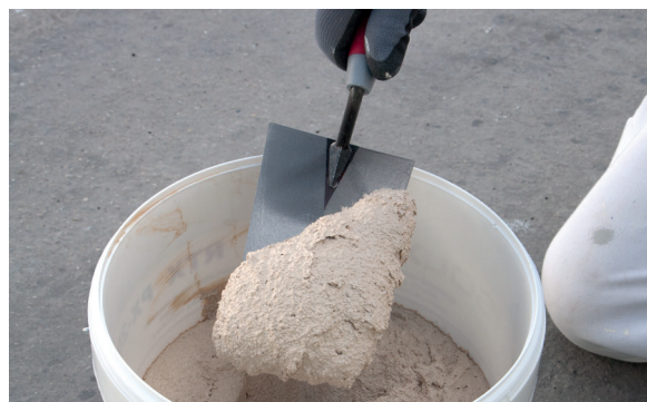
2. Extraer el PX-28 Isolxtrem SILOXANE TECHNOLOGY G con la ayuda de una paleta.