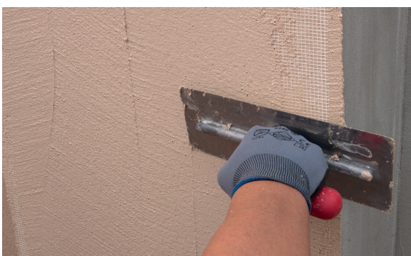
9. Alisar el PX-28 Isolxtrem SILOXANE TECHNOLOGY G depositado sobre la malla.