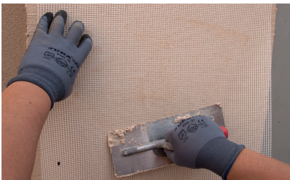
7. Colocar la malla RG-116 Isolxtrem System.