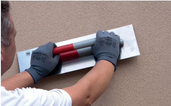
5. Alisar el PX-28 Isolxtrem SILOXANE TECHNOLOGY G.