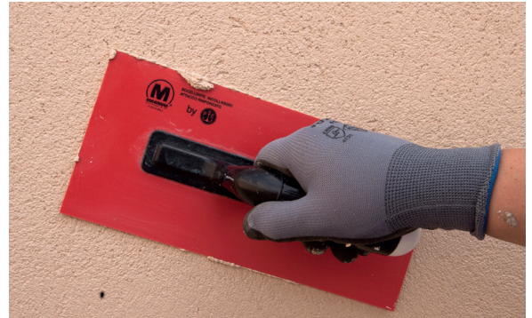
6. Fratar el PX-28 Isolxtrem SILOXANE TECHNOLOGY G.