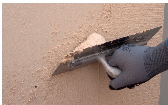
4. Aplicar PX-28 Isolxtrem SILOXANE TECHNOLOGY G sobre el soporte.