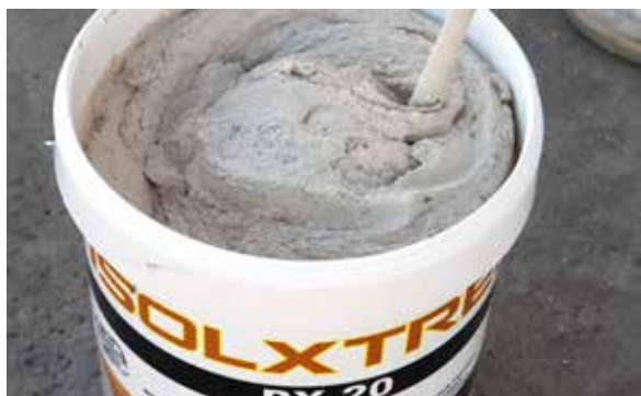
1. Malaxer avant application

Si l'on souhaite utiliser ce produit comme système anti-fissures, appliquer une 1 ère couche de PX-28 (voir photo N°4), dans laquelle il faudra immédiatement insérer la maille de verre en la marouflant (voir photo N°7). Aussitôt, frais sur frais, appliquer une autre couche de produit afin de recouvrir en totalité la maille de verre (voir photos N° 8 et 9). Pour finaliser, frotter le produit (voir photo N°6) jusqu'à l'obtention d'une surface plane, imperméable et d'aspect décoratif (voir photo N°10).