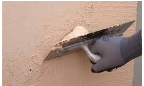
4. Appliquer le produit sur le support