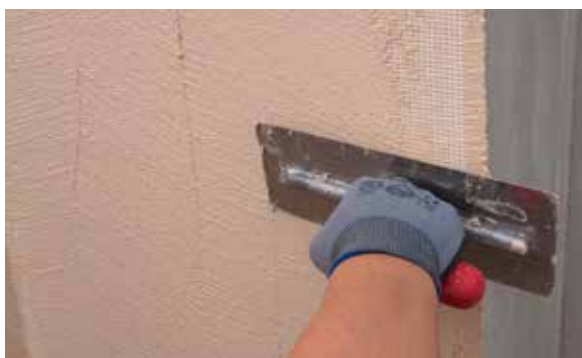
9. Lisser le produit jusqu'au recouvrement complet de la maille de verre