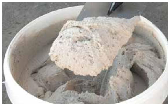
2. Extraire le produit avec une lame ou un couteau