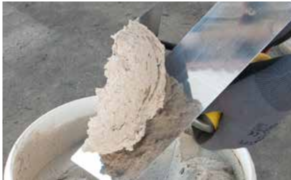
3. Déposer et répartir le produit sur une taloche ou une lisseuse