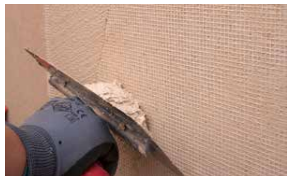
8. Recouvrir la maille de verre en totalité en appliquant une seconde couche de produit