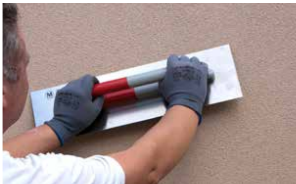
5. Egaliser et lisser