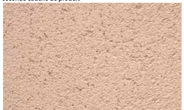
10. Résultat final obtenu après séchage