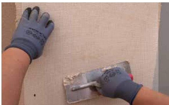
7. Positionner et insérer la maille de verre RG-116